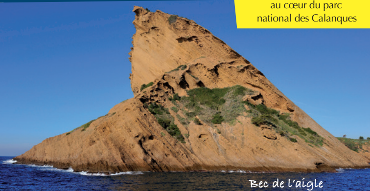
Bec de l'aigle

Visite commentée au cœur du parc national des Calanques