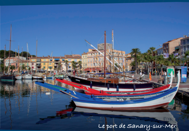
Le port de Sanary-sur-Mer

À noter que le navire sera en activité pendant les vacances de Noël et d'hiver.