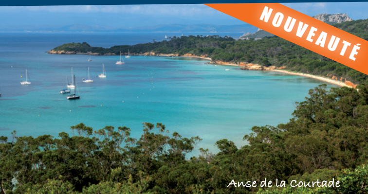
Anse de la Courtade

En naviguant sur les eaux turquoise qui bordent l'île, nous vous proposons une visite commentée d'1h30 pour y découvrir ses paysages contrastés, emblématiques de cette nature méditerranéenne : le sud de Porquerolles et ses reliefs sauvages, découpés, abritant de magnifiques calanques, contrastant avec le nord de l'île et ses grandes plages de sables ceinturées de pins d'Alep.