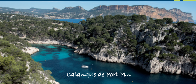
Calanque de Port Pin